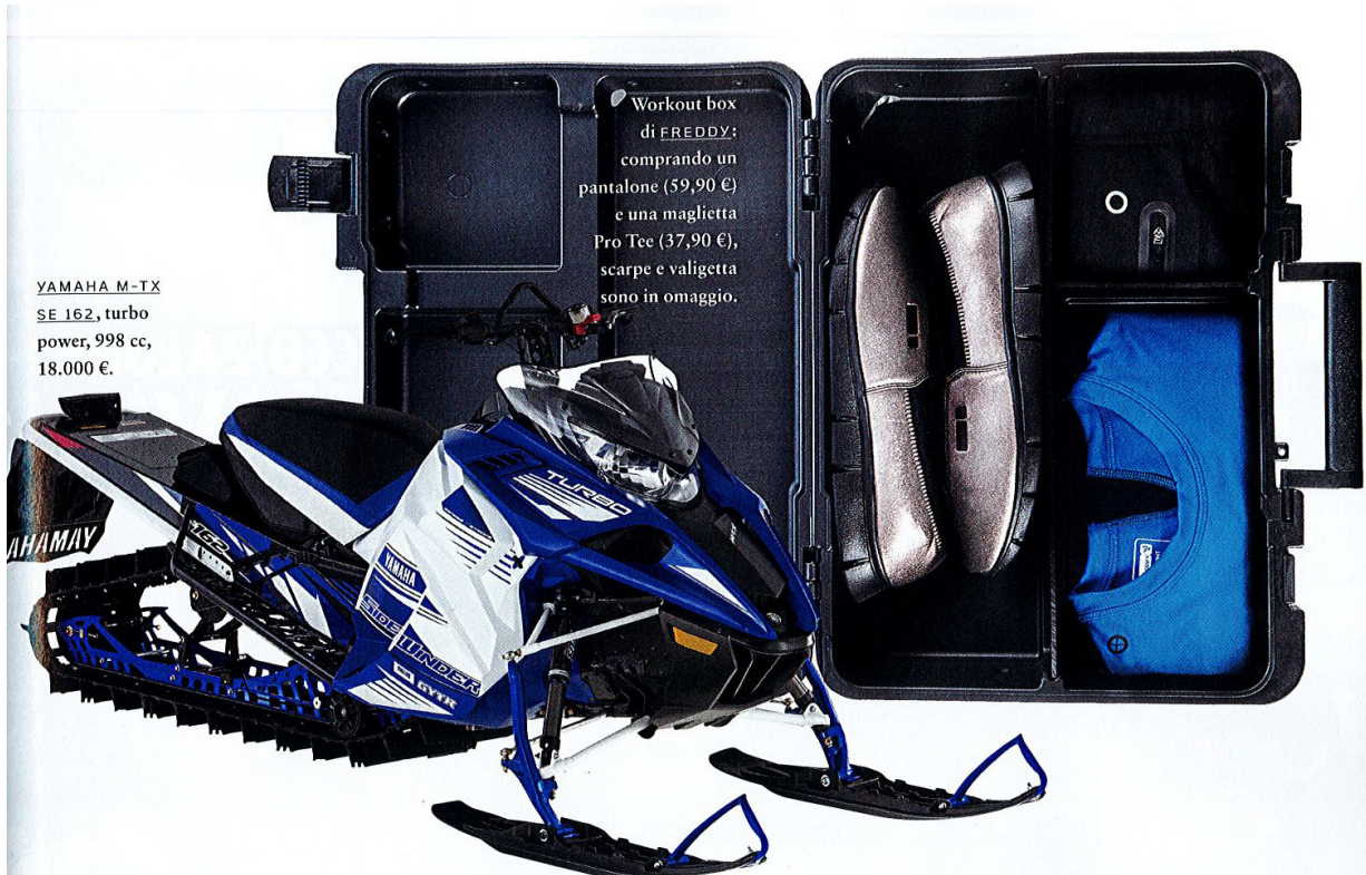
YAMAHA M-TX SE 162, turbo power, 998 cc, 18.000 €.

Workout box di FREDDY : comprando un pantalone (59,90 €) e una maglietta Pro Tee (37,90 €), scarpe e valigetta sono in omaggio.