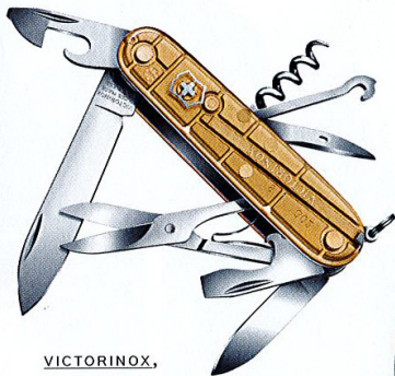
VICTORINOX , con guancette placcate in oro, 64,10 €.

Workout box di FREDDY : comprando un pantalone (59,90 €) e una maglietta Pro Tee (37,90 €), scarpe e valigetta sono in omaggio.