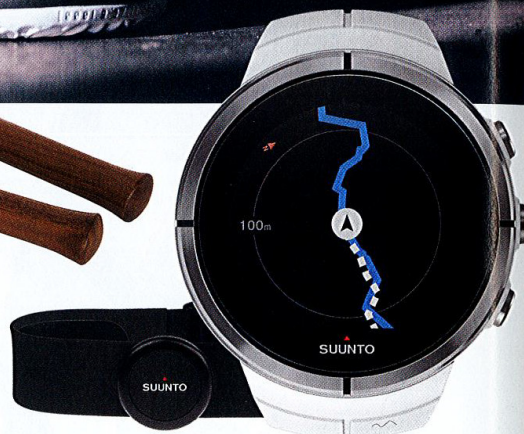
Spartan Ultra White HR, GPS e touch screen multisport di SUUNTO, 699 €.