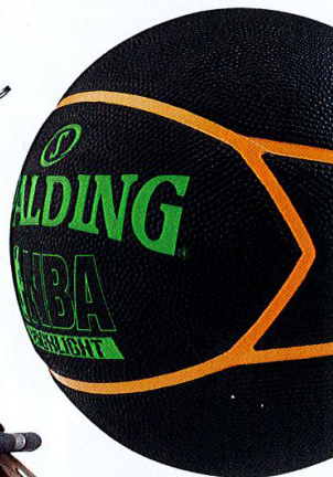
Pallone da basket NBA Highlight di SPALDING , 32 €.

tecnico. È una moda che fa decollare il settore. A Natale poi c'è il comparto neve, in cui prevalgono gli sci sempre più high-tech ».