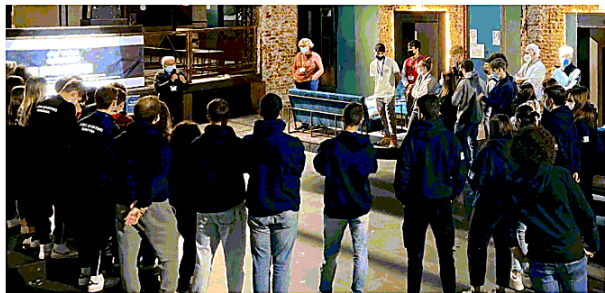
Alcune fasi del "Play your future Challenge": le finali a Torino, gli organizzatori, e la chiusura ufficiale a Verona. A destra il ministro dell'Istruzione Patrizio Bianchi assieme ai ragazzi del liceo Des Ambrois di Oulx