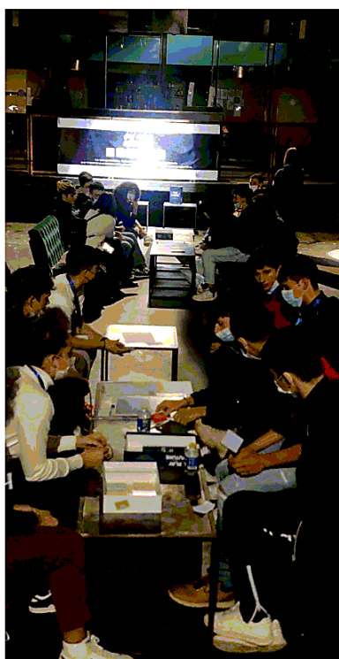
Le fasi finali del torneo "Play your future Challenge" si sono svolte a Torino, al Milk, martedì scorso. Prima l'ultima tornata di sfide tra licei, poi l'incontro con le aziende e realtà produttive dello sport a livello regionale e nazionale

SI È TENUTA A TORINO LA FASE FINALE DEL "TORNEO" CON I RAGAZZI DEI LICEI SPORTIVI DI TUTTA ITALIA. IERI LA CHIUSURA UFFICIALE A VERONA CON IL MINISTRO DELL'ISTRUZIONE. BRAVO LICEO DES AMBROIS!